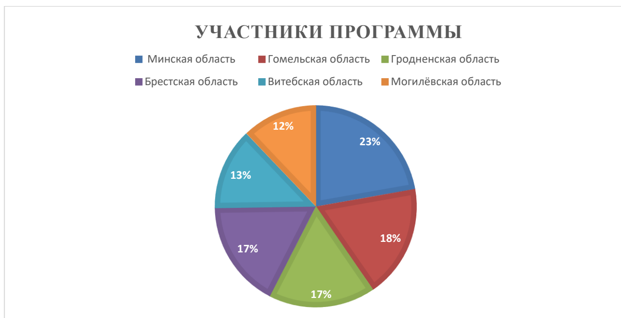
Диаграмма 1. Количество вступивших в ДНПС по областям на 2024 год

По данным журнала «Страхование Беларуси», за первые два года действия новой программы было заключено уже почти 37 тыс. договоров страхования. В систему ДНПС вовлечены порядка 7 тыс. предприятий и организаций. Рассмотрим диаграмму 1, на которой представлены результаты по всем областям Беларуси: