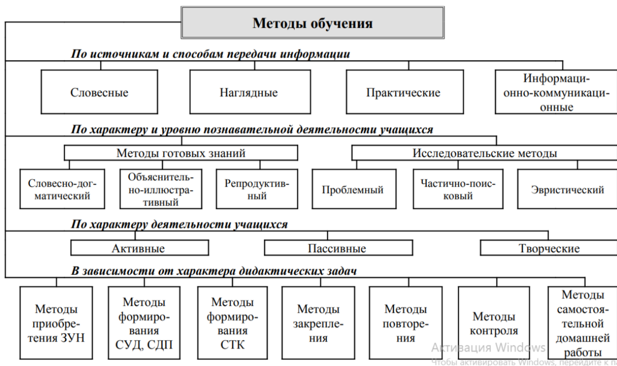
Рис. 1. Классификация методов обучения

Особенность активных методов обучения заключается в [18]: