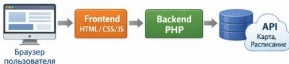
Рис. 2. Архитектура веб-приложения

Структура сайта разработана таким образом, чтобы обеспечить удобство навигации и доступность информации. Главная страница содержит баннер, статистические данные и основные преимущества обучения. Раздел «Об училище» включает историю, миссию, руководство и лицензии. Раздел «Специальности» представляет собой каталог программ обучения с возможностью поиска и фильтрации. Раздел «Новости» содержит актуальные события и публикации, а раздел «Отзывы выпускников» предоставляет возможность ознакомиться с мнениями обучающихся. Раздел «Расписание занятий» включает таблицу с фильтрами по группам, что позволяет пользователю быстро находить необходимую информацию. Логическая схема модулей сайта представлена на рисунке 3.