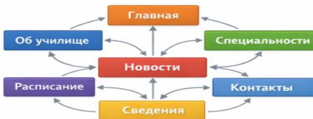
Рис. 1. Структура веб-сайта

Основные функции системы включают: сбор данных о действиях пользователя; анализ видеопотока с камеры; обработку данных с использованием нейронных сетей; формирование отчетов и аналитики.