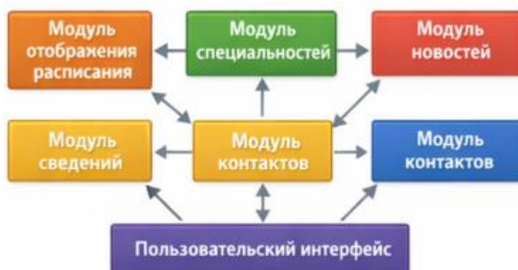
Рис. 3. Логическая схема модулей сайта

Структура сайта разработана таким образом, чтобы обеспечить удобство навигации и доступность информации. Главная страница содержит баннер, статистические данные и основные преимущества обучения. Раздел «Об училище» включает историю, миссию, руководство и лицензии. Раздел «Специальности» представляет собой каталог программ обучения с возможностью поиска и фильтрации. Раздел «Новости» содержит актуальные события и публикации, а раздел «Отзывы выпускников» предоставляет возможность ознакомиться с мнениями обучающихся. Раздел «Расписание занятий» включает таблицу с фильтрами по группам, что позволяет пользователю быстро находить необходимую информацию. Логическая схема модулей сайта представлена на рисунке 3.