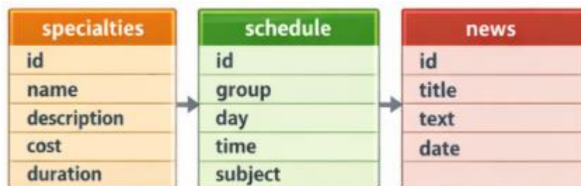
Рис. 4. Структура базы данных

При разработке сайта применялись современные веб-технологии, обеспечивающие высокую производительность, удобство использования и адаптивность интерфейса. HTML5 используется для структурирования контента, CSS3 — для стилизации и адаптивной вёрстки, JavaScript — для реализации интерактивных элементов и динамического обновления данных. PHP обеспечивает обработку форм и взаимодействие с сервером, а Yandex Maps API используется для отображения карты. Адаптивная вёрстка позволяет корректно отображать сайт на мобильных устройствах, что является важным требованием современного веб-дизайна.