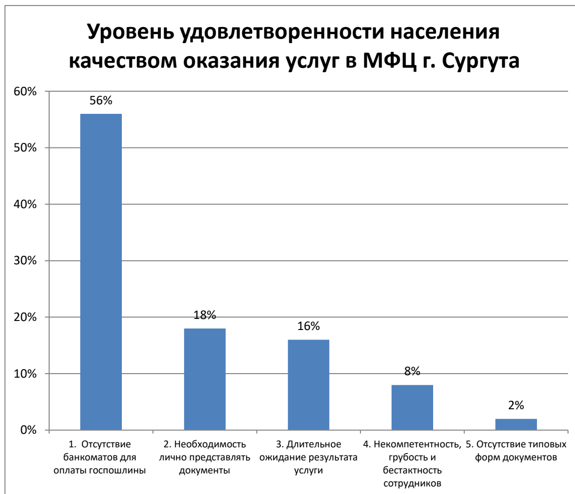
Рис.1 Уровень удовлетворенности населения качеством оказания услуг в МФЦ г. Сургута

Наглядно результаты проведенного опроса представлены на рисунке 1.