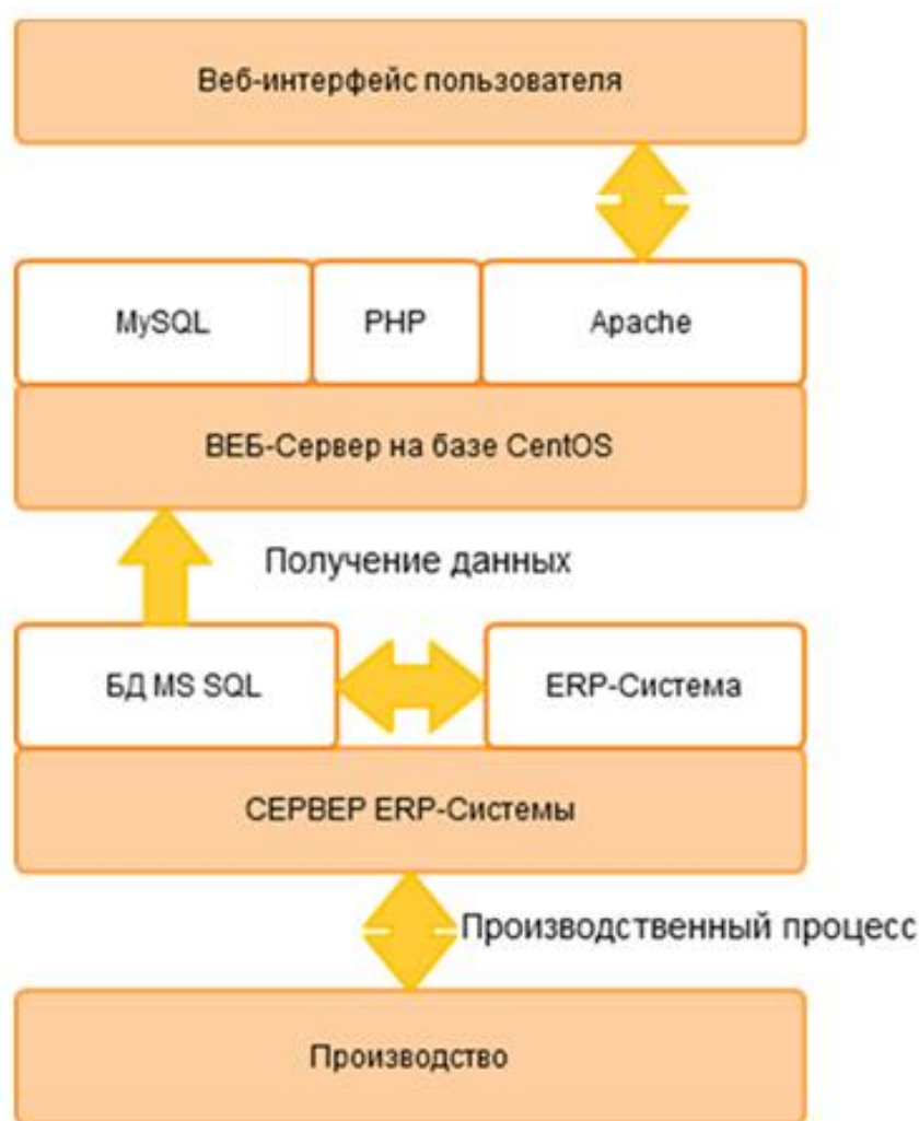
Рис. 1. Схема выполнения запросов и обмена данными

Для достижения цели требуется решить ряд задач. Прежде всего необходимо определить для формируемого веб-сервера тот функционал, который должен быть в него заложен. Важное внимание необходимо уделять характеристикам отказоустойчивости в ходе того, как происходит процесс передачи данных [2] от ERP-системы. Дадим описание общих особенностей того, как работает веб-сервер. Различная информация поступает от рабочих станций, существующих в организации к ERP-системе. После этого происходит передача таких данных к БД Progress, которая размещена на сервере. На рис 1. показан процесс передачи информационных массивов.