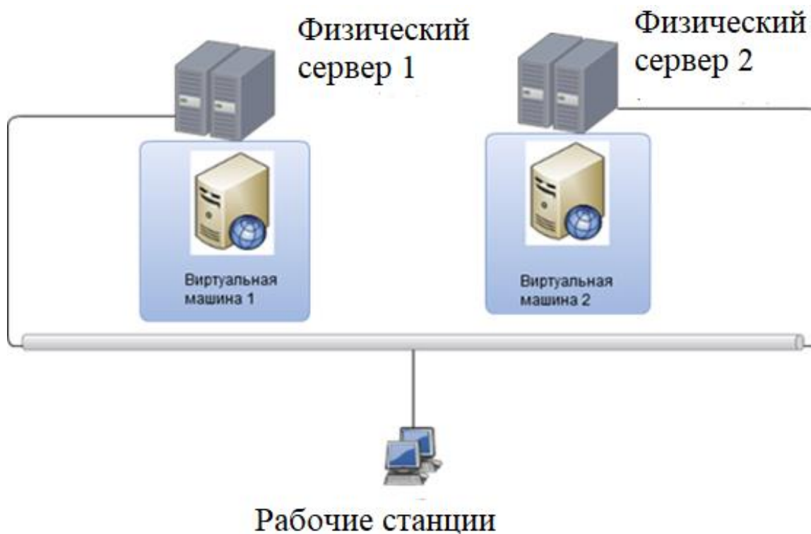
Рис. 4. Схема веб-сервера, с оптимизированной структурой

На рис. 4 представлена схема веб-сервера с оптимизированной структурой.