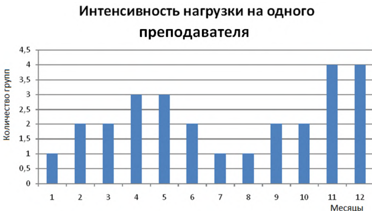
Рис. 4. Интенсивность загрузки преподавателя в сфере переподготовки кадров

Так, доход наиболее квалифицированных преподавателей, как правило, превышает доход менеджеров и административного персонала и составляет в среднем от 80 до 250 т.р. в месяц в ценах 2017 года, при неравномерной средней загрузке в течении года (см. рис. 4).