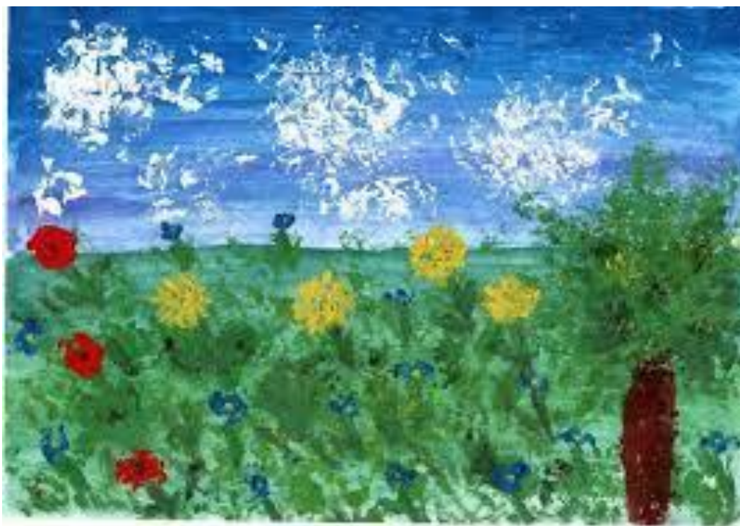
Рис. 3. Летний пейзаж в технике «оттиск мятой бумагой»