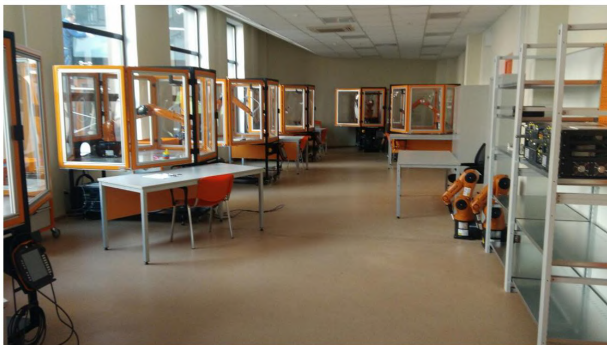
Рис. 2. Учебный класс робототехники учебного центра межрегионального центра компетенций, г. Екатеринбург

На основе многих таких центров были созданы специализированные учреждения с образовательными направлениями, определяемыми требованиями основной деятельности. Центры оснащены современным обучающим оборудованием, а оборудование массово закупается у различных компаний (см. рисунок 2, 3).