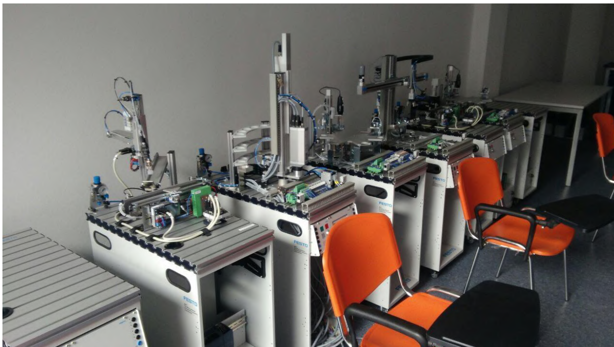
Рис. 3. Класс пневмоавтоматики учебного центра межрегионального центра компетенций г. Екатеринбург

повышения квалификации персонала предприятий. В Центрах стимулируется работа по переподготовке специалистов как базовых, так и внешних предприятий на коммерческой основе. По уровню оснащения эти центры как минимум не уступают, а по ряду направлений превосходят профильные вузы.