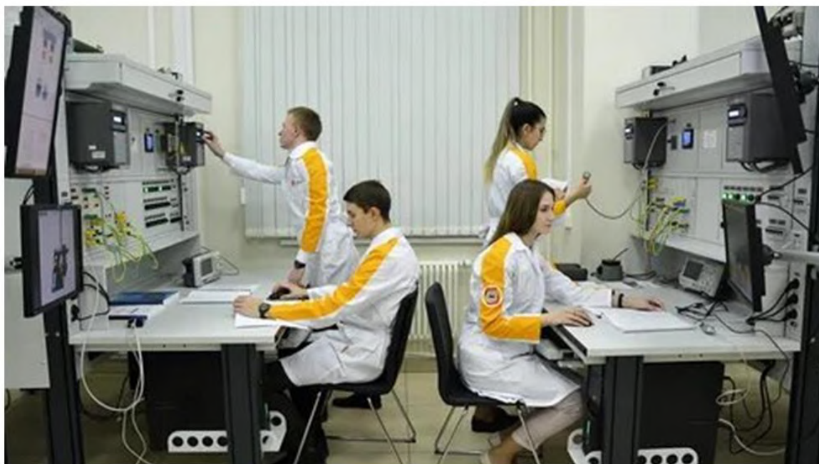
Рис. 5. Пример специализированного класса центра переподготовки кадров

Динамически, в соответствии с требованиями рынка обновляются и программы обучения, так, 40% из 300 базовых программ обновляются или заменяются в течение года [8]. При этом востребованы как узкоспециализированные программы, так и программы подготовки универсальных специалистов.