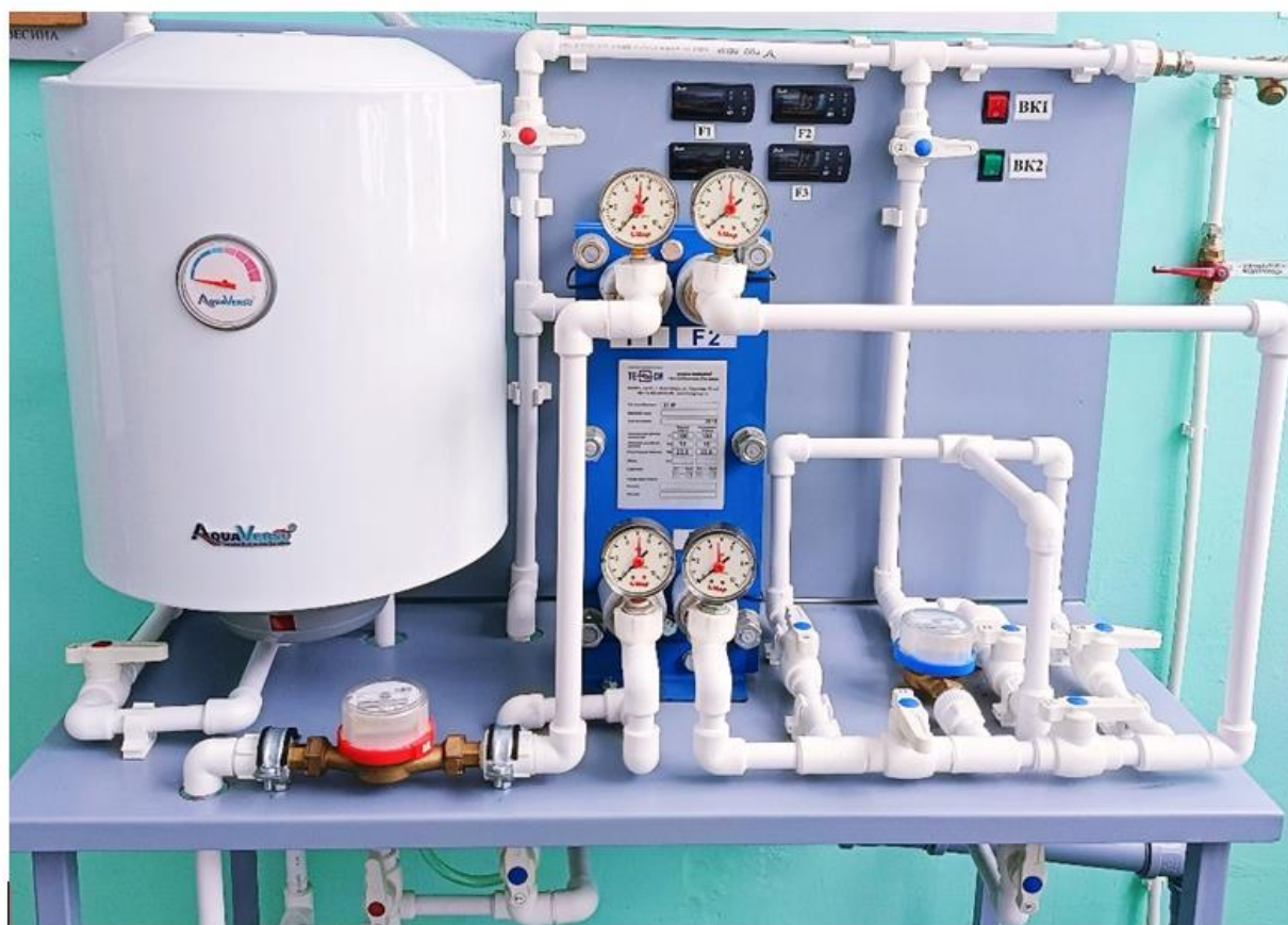
Рис. 2. Лабораторный стенд пластинчатого теплообменного аппарата

теплообменного аппарата, работающий в лаборатории Холодильной техники кафедры МАПП Алтайского государственного технического университета им. И.И.Ползунова, выполненный в рамках магистерской диссертации и изготовленный на предприятии ООО «Алтайторгтехника», где работает много выпускников кафедры. Стоимость стенда на порядок меньше, чем серийно выпускаемых, однако и здесь возникают сложности с финансированием.