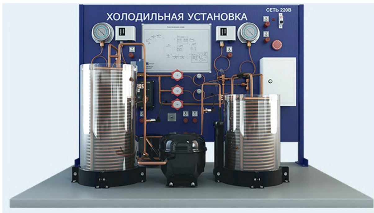
Рис. 1. Общий вид стенда

стенда показан на рисунке 1. Безусловно, это самый эффективный вариант обновления и развития материально-технической базы, который полностью отвечает всем требованиям, изложенным во ФГОС.