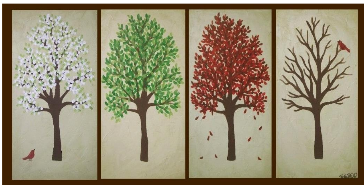
Рис. 2. Рисунок деревьев в разное время года, выполненный гуашью