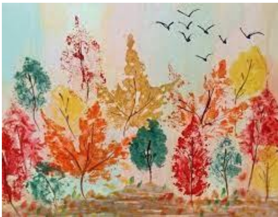
Рис. 5. Осенний пейзаж в технике «отпечатки листьев»

Можно создать вместе с детьми сезонный календарь: назначить каждому ребенку определенный месяц и попросить его проиллюстрировать этот месяц рисунками, изображающими соответствующее время года, используя различные техники рисования.