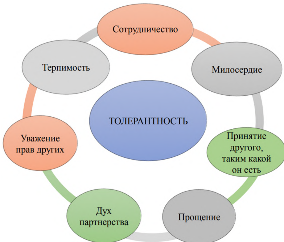
Рис. 1. Составляющие понятия толерантности

Исходя из вышеперечисленного, мы можем сказать, что толерантность – сложный процесс, включающий разные аспекты формирования будущей личности с духовно-нравственными взглядами на мир, общество, окружающих.