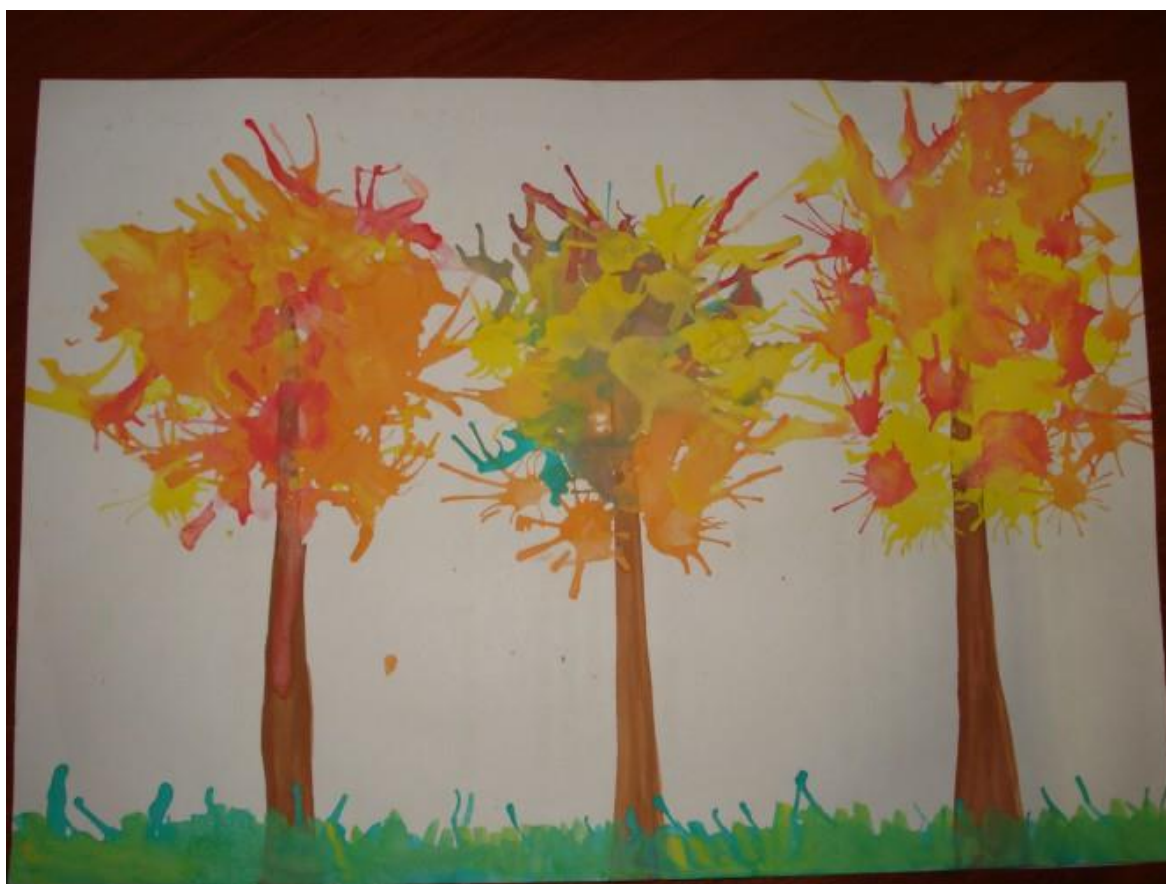
Рис. 4. Осенний пейзаж в технике «кляксография»