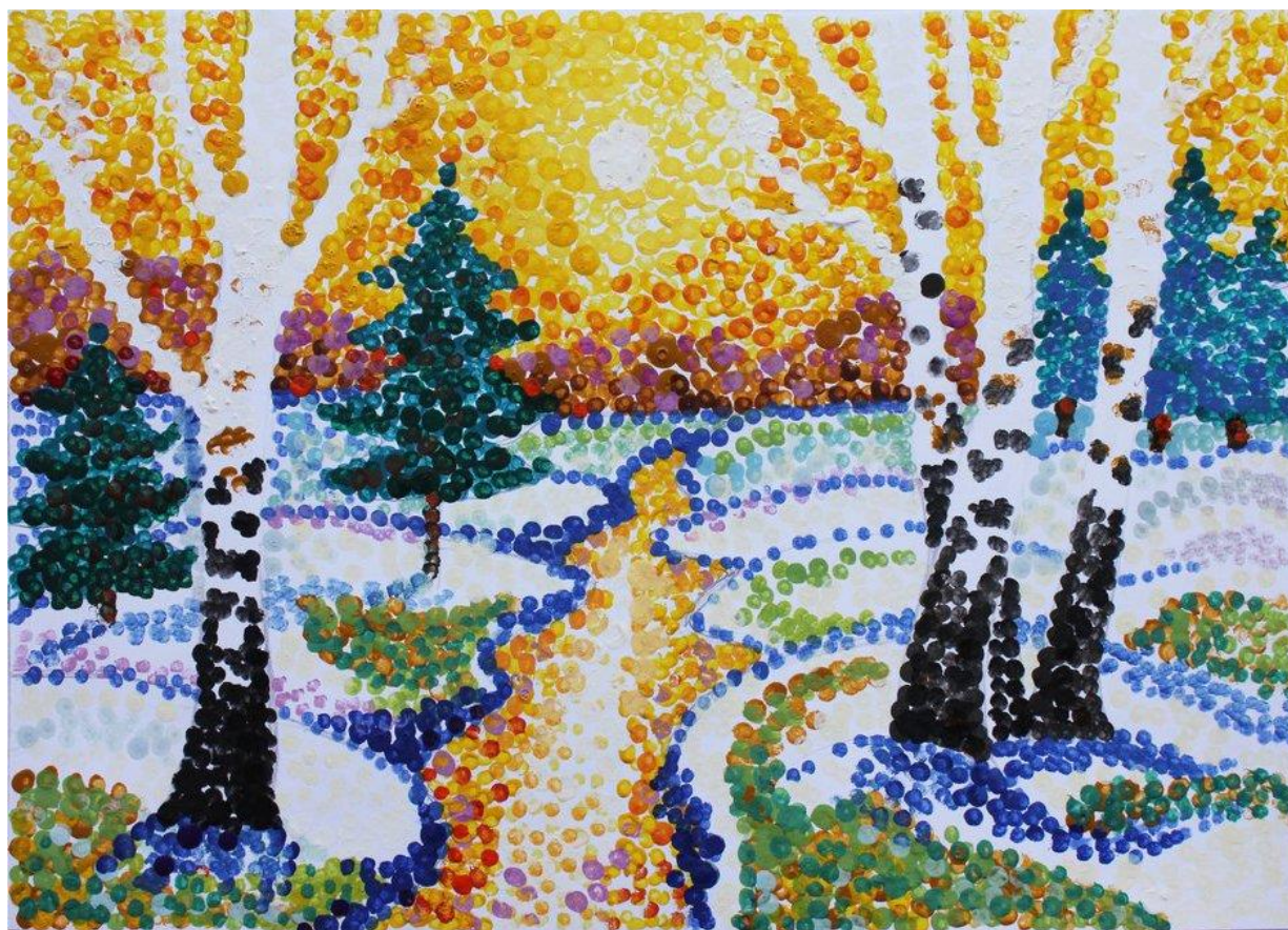
Рис. 1. Рисунок осени в технике «тычки»